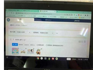
アンケートの画面2

聞くと、「夏休み明けで、生活リズムが崩れているかもしれないから、アンケートをとって生活リズムを見直す活動をしたい」とのこと。そして、自分達でクロームブック(タブレット)で作成したアンケートを見せてくれました。アンケートをとった後の活用法など、いくつかの気になる点を質問し、確認しました。後日、再度企画書を提案することになりました。