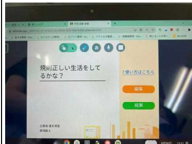
アンケートの画面1

8月26日、委員会の時間、保健委員会の児童が、企画書をもって、校長室へ来室。活動の提案がありました。